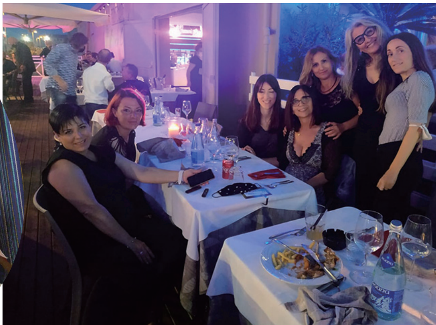
le ragazze di Rimini in festa e la nostra esperta massaggiatrice al lavoro