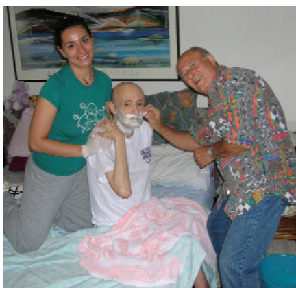
ASSISTENZA ALLA PERSONA