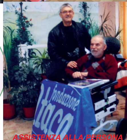
ASSISTENZA ALLA PERSONA