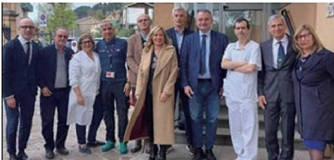
I Sindaci ed i vertici dell'AUSL alla presentazione del nuovo progetto di ospedale di comunità al Simiani di Loiano

L'ospedale di comunità verrà creato nell'ala del nosocomio che ospitava la Residenza per Anziani