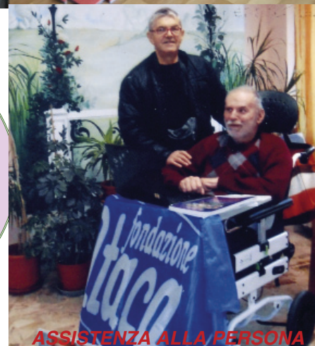
ASSISTENZA ALLA PERSONA

I CONTRIBUTI VERSATI SONO DEDUCIBILI • dalle persone giuridiche: senza limite d'importo Legge 23.12.2005 n. 266 art. 1 comma 353 e Decreto Presidente Consiglio dei Ministri 8.5.2007 e 25.2.2009. • dalle persone fisiche: nella misura massima del 10% del reddito imponibile o fino a euro 70.000 (vale il minore dei due limiti) Decreto Legge 14 marzo 2005 n. 35 e art. 14 e Decreti Presidente Consiglio dei Ministri 8.5.2007 e 25.2.2009. Per ottenere la deducibilità i contributi devono essere versati attraverso il sistema bancario o postale, allegando alla propria dichiarazione dei redditi il documento idoneo attestante il versamento effettuato (es. contabile bancaria, estratto conto, vaglia postale).