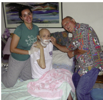
ASSISTENZA ALLA PERSONA