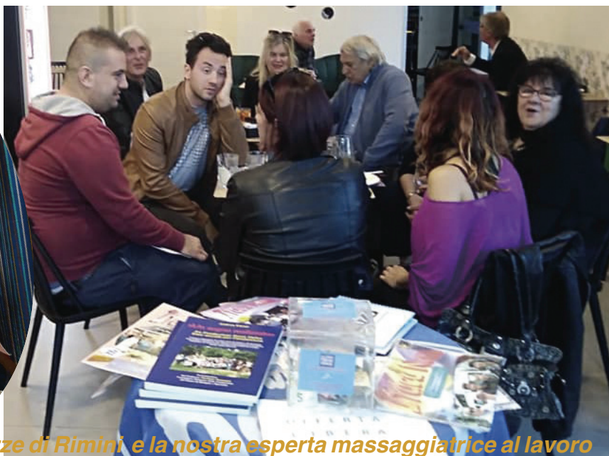
Una bella iniziativa delle ragazze di Rimini e la nostra esperta massaggiatrice al lavoro